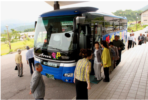
たしまいざごうとがりあ々方た