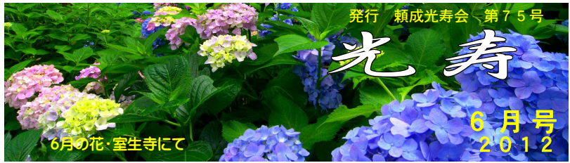
6月の花・室生寺にて